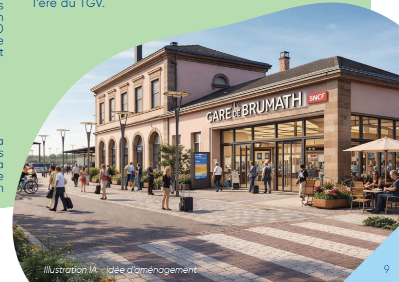
Illustration IA - idée d'aménagement