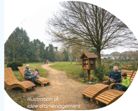
Illustration IA idée d'aménagement